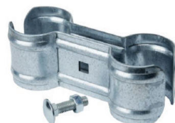
Fixation pour panneaux mobiles