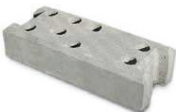
Base de béton pour la fixation des panneaux.